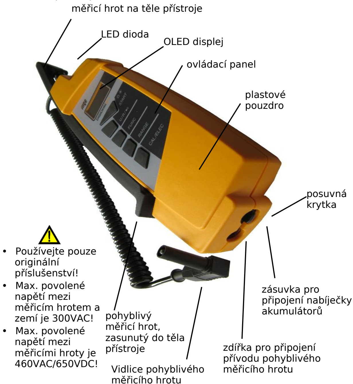
Obr. 2.1. Pohled shora

Pokud není přístroj používán, je možno druhý/pohyblivý měřicí hrot zasunout do těla přístroje takovým způsobem, že tvoří kompaktní celek, přičemž ostré konce měřících hrotů jsou bezpečně ukryty. Při každému vysunutí jsou oba díly zajištěny bezkontaktní magnetickou západkou.