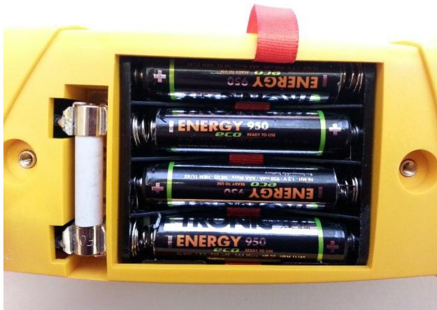
Obr. 4.1 Správná polarita napájecích článků a umístění pojistky

Baterie/akumulátory se do přístroje vkládají po vyšroubování 2 ks šroubů a po odejmutí víčka prostoru pro baterie a pojistky, viz. obr. 2.2. Poté vyjměte napájecí články a nové vložte do přístroje. Dodržujte přitom správnou polaritu: