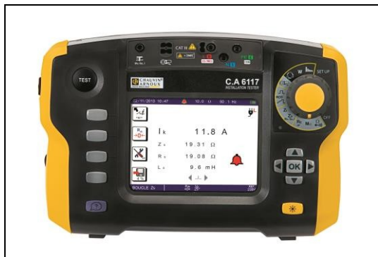
C.A 6116N, C.A 6117