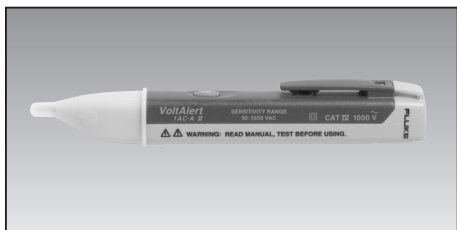
Fluke 1 AC VoltAlert