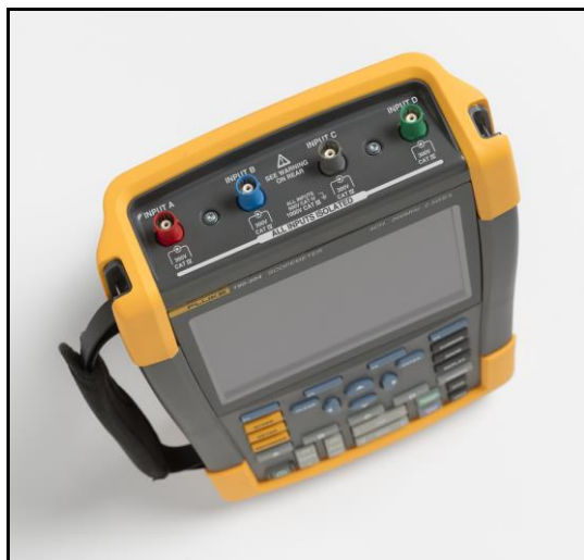
Fluke 190-204 (pohled shora)