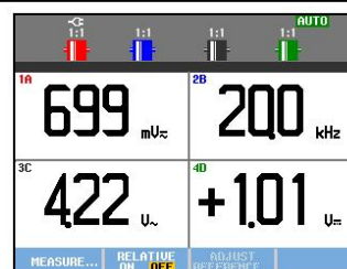
Naměřené hodnoty v režimu MULTIMETR